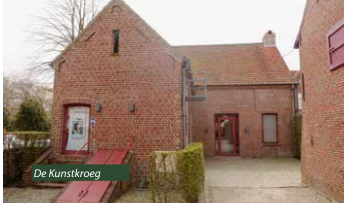
De Kunst kroeg

In onze schoolboeken lezen we dat de Guldensporenslag plaatsvond op woensdag 11 juli 1302 op het Groeningeveld in Kortrijk. De milities van het graafschap Vlaanderen (dat betrof enkel het gebied rond de provincies West- en Oost-Vlaanderen) en het leger van de Franse koning vochten er een bittere strijd uit. De slag was in militair opzicht opmerkelijk omdat een handvol Vlaamse piekeniers en boogschutters de overwinning behaalden op een reusachtig Frans ridderleger.