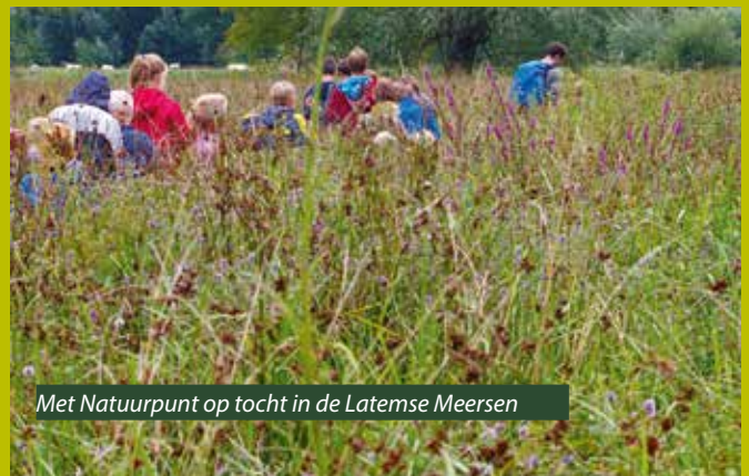
Met Natuurpunt op tocht in de Latemse Meersen