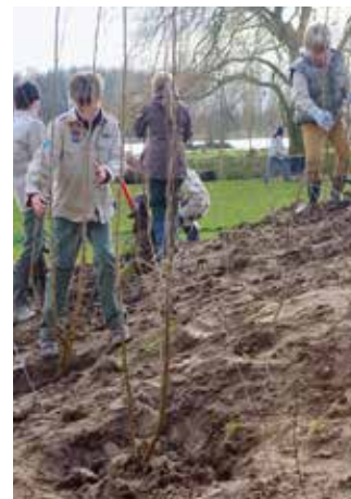
Op zaterdag 28 februari 2015 plantten de scouts en buurtbewoners heel wat bomen voor het speelgroenproject aan De Nark en De Oase.