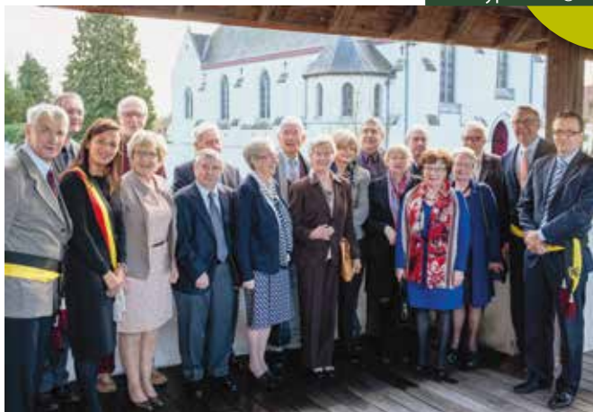
Op 6 december 2014 werden maar liefst 14 jubilarissen in de bloemetjes gezet.