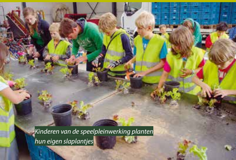
Kinderen van de speelpleinwerking planten hun eigen slaplantjes