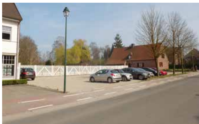
Aangenamer winkelen in eigen gemeente dankzij de nieuwe publieke parking in de Maenhoutstraat.