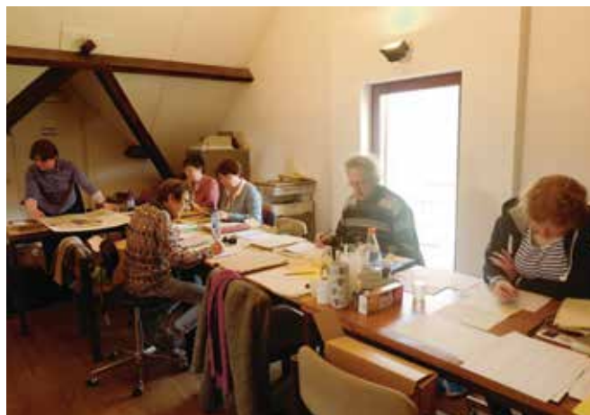
Wekelijkse bijeenkomst van enkele vrijwilligers voor het archiveren van het Gevaert-archief in het Documentatie- en Archiefcentrum.