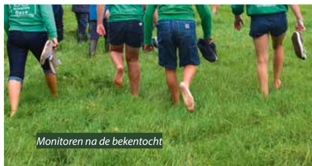
Monitoren na de bekentocht

Word dan monitor op speelplein Oase! Je kan je kandidaat stellen door een mailtje te sturen naar speelpleinwerking@sint-martens-latem.be .