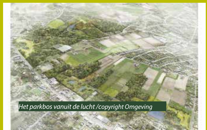
Het parkbos vanuit de lucht /copyright Omgeving

Al in het voorjaar en de zomer van 2014 werden de meeste paden in het valleigebied aangelegd. Enkele delen konden door de hoge waterstand in oktober 2014 niet meer afgewerkt worden. De aannemer hervat de werken zodra het terrein voldoende droog is (vermoedelijk mei 2015). Dan wordt het pad tussen Turrebos en de Blaupoort afgewerkt; dit deel is nu nog niet toegankelijk. Langs het nieuwe pad worden banken en informatiepanelen geplaatst. De Rosdambeekroute is een wandeltocht van 5,5 kilometer die vertrekt vanuit de Rosdamstraat en je door het natuurgebied via de Oosterdijk naar de Keistraat brengt. Vanuit de Keistraat ga je door de wijk naar Geetschuren en de boskern Grand Noble. Het wandelpad brengt je van hieruit terug naar de Rosdamstraat of het portaal Grand Noble.