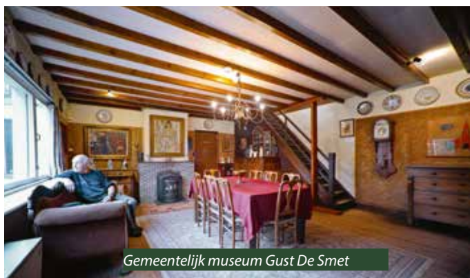
Gemeentelijk museum Gust De Smet